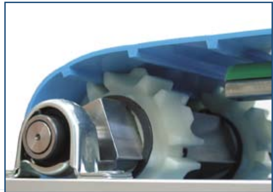
Mit Trommeln der Serien Intralox 800

Für eine maximale Leistung empfehlen wir von VOLTA gelieferte Trommeln. VOLTA Trommeln können Sie unter Verwendung der normalen Standard Methoden auf rechteckige Achsen montieren und befestigen.