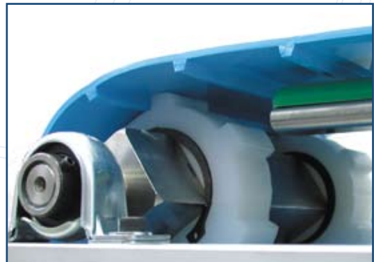
Mit von Volta gelieferten Trommeln